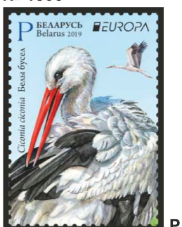
Белы бусел (Белый аист)