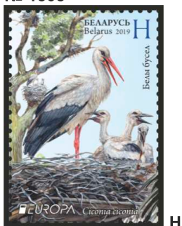
Белы бусел (Белый аист)