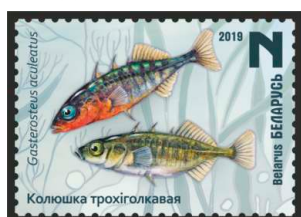
Колышка трохіголкаявая (Колышка трехиглая)