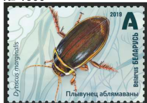
Плывунец аблямаваны (Плавунец окаймленный)