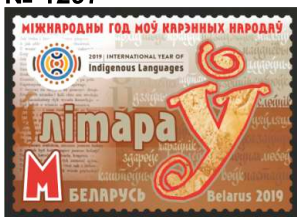
Міжнародны год моў карэнных народаў (Международный год языков коренных народов)