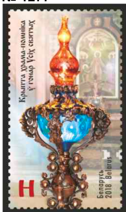
Крыпта храма-помніка ў гонар Усіх святых (Крипта храма-памятника в честь Всех святых)