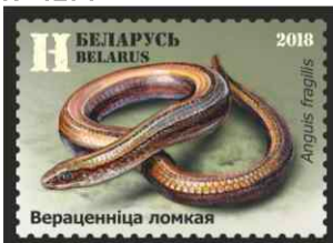
Вераценніца ломкая (Веретеница ломкая)