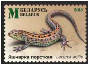
Яшчарка порсткая (Ящерица прыткая)