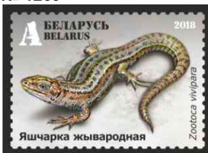
Яшчарка жывародная (Ящерица живородящая)