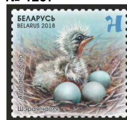
Шэрая чапля (Серая цапля)