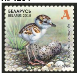
Вялікі зук (Галстучник)