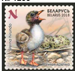
Рачная крычка (Речная крачка)