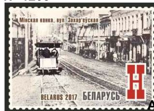
Мінская конка, вул. Захар'еўская (Минская конка, ул. Захарьевская)