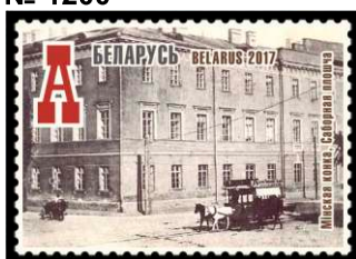
Мінская конка, Саборная плошча (Минская конка, Соборная площадь)