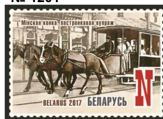
Мінская конка, пастронкавая вупраж (Минская конка, постромочная упряжь)