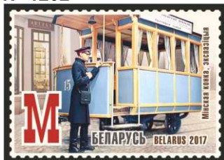
Мінская конка, экспазіцыя (Минская конка, экспозиция)