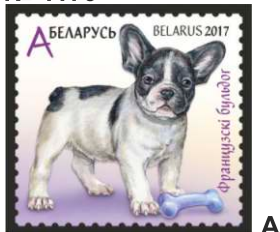
Французскі бульдог (Французский бульдог)