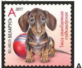
Такса стандартная гладкашэрсная (Такса стандартная гладкошерстная)