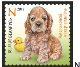
Амерыканскі кокер-спаніэль (Американский кокер-спаниель)