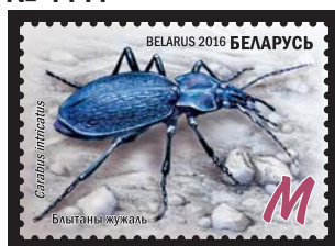
Блытаны жужаль (Путаная жужелица)