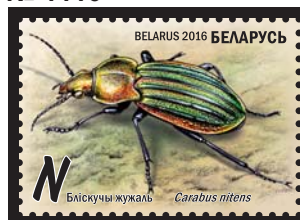
Бліскучы жужаль (Блестящая жужелица)