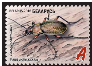
Рашэцісты жужаль (Решетчатая жужелица)