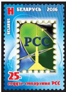
25-годдзе стварэння РСС (25-летие образования РСС)