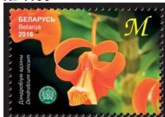
Дэндэробіум адзіны (Дендробиум единственный)