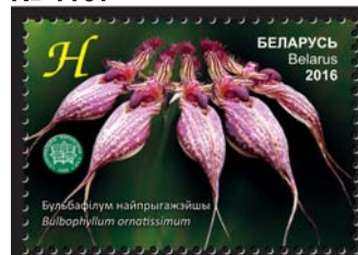
Бульбафілум найпрыгажэйшы (Бульбофиллум красивейший)