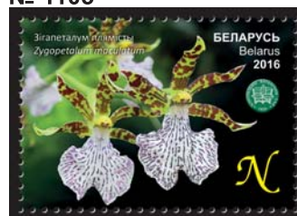
Зігопеталум плямісты (Зигопеталум пятнистый)