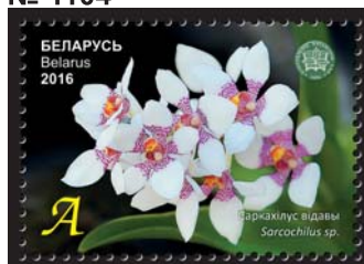
Саркохилус відавы (Саркохилус видовой)