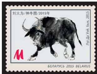
Луи Да Уэй. Бык. 2015 (Луи Да Уэй. Бык. 2015)