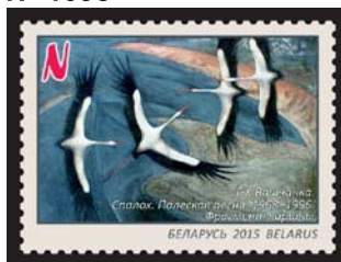
Г.Х.Вашчанка. Спалох. Палеская песня. 1968–1996. Фрагмент карціны (Г.Х.Ващенко. Всполох. Полесская песня. 1968–1996. Фрагмент картины)