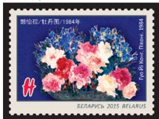
Гуо Йи Конг. Піwonі. 1984 (Гуо Йи Конг. Пионы. 1984)