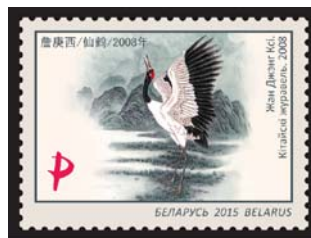
Жан Джэнг Ксі. Кітайскі журавель. 2008 (Жан Дженг Кси. Китайский журавль. 2008)