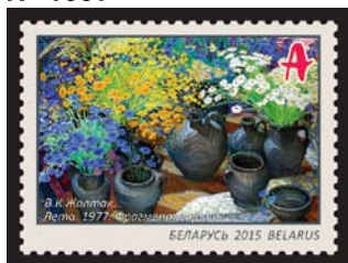
В.К.Жолтак. Лета. 1977. Фрагмент карціны (В.К.Жолтак. Лета. 1977. Фрагмент картины)