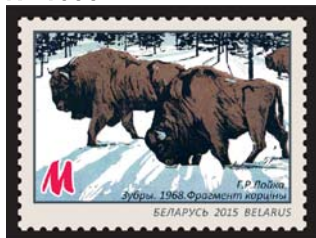
Г.Р.Лойка. Зубры. 1968. Фрагмент карціны (Г.Г.Лойко. Зубры. 1968. Фрагмент картины)