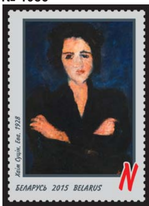
Хаім Сутін. Ева. 1928 (Хаим Сутин. Ева. 1928)