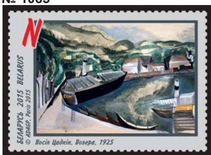
Восіп Цадкін. Возера. 1925 (Осип Цадкин. Озеро. 1925)