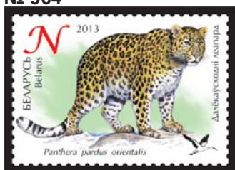
Далёкаўсходні леопард (Дальневосточный леопард)