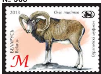
Еўрапейскі муфлон (Европейский муфлон)