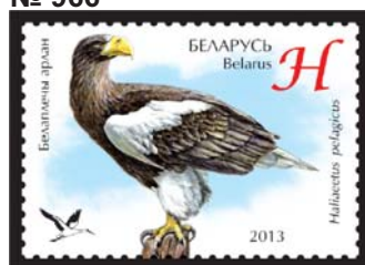
Белаплечы арлан (Белоплечий орлан)