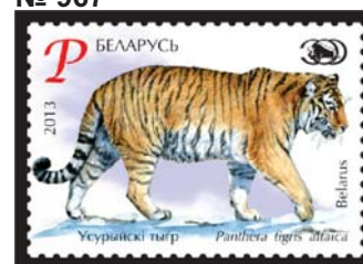
Усурыіскі тыгр (Уссурийский тигр)