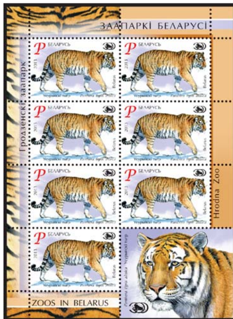
Маркі печаталіся с эмблемамі зоопаркаў.