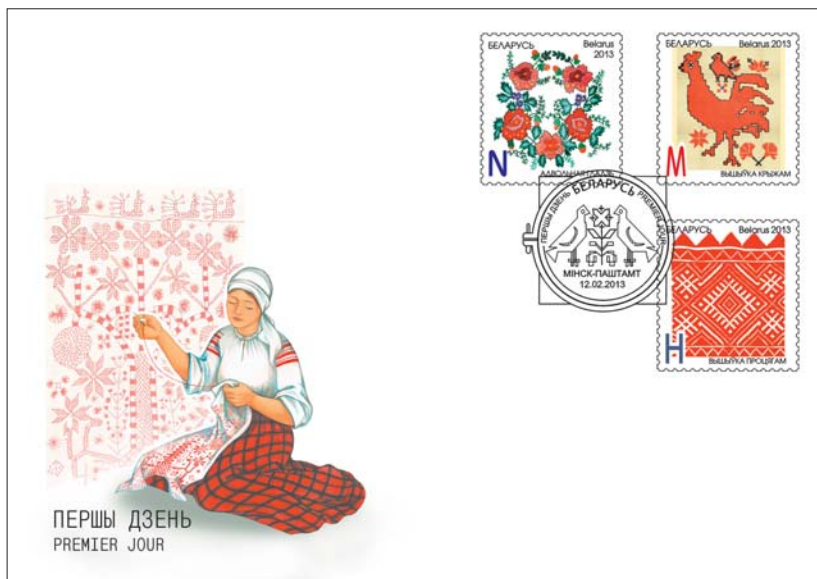
Рисунок с геометрическими формами выполняется преимущественно счётной вышивкой (отсчётом нитей полотна), а криволинейный рисунок — «свободной» вышивкой (по нанесённому заранее контуру).

Бесконечно разнообразны виды швов для «глухой» вышивки (по целой ткани): крест, гладь, набор, роспись, тамбури др.