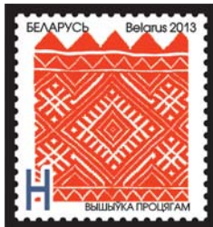
Вышыўка процягам (Вышивка набором)