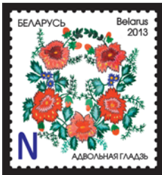
Адвольная гладзь (Свободная гладь)