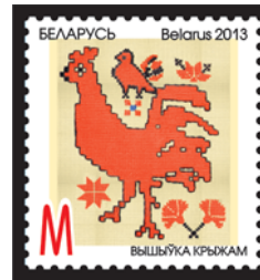
Вышыўка крывам (Вышивка крестом)