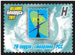
20-годдзе стварэння РСС (20-летие образования РСС)