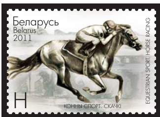
Конны спорт. Скачки (Конный спорт. Скачки) H