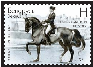
Конны спорт. Выездка (Конный спорт. Выездка)