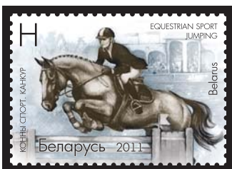
Конны спорт. Канкур (Конный спорт. Конкур) H