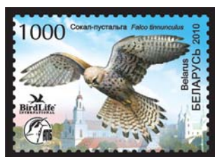
Сокал-пустельга (Обыкновенная пустельга).