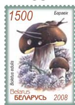
Боровик. 1500 руб.