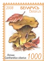
Лисичка. 1000 руб.