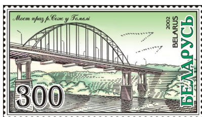
Мост через р. Сож в Гомеле