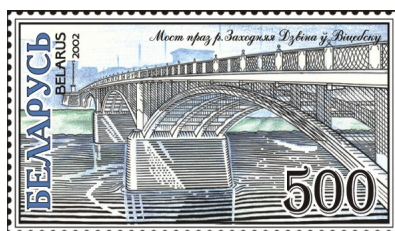
Мост через р. Западная Двина в Витебске