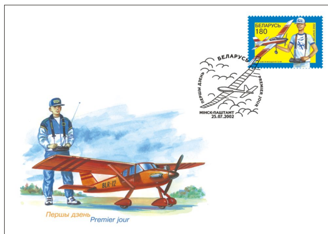
Першы дзень Premier jour

В день выхода марки в обращение на Минском почтамте будет проводиться специальное гашение на конверте «Первого дня».