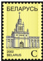
Железнодорожный вокзал в Бресте

На марках применены элементы защиты: микротекст, а также текст "БЕЛАРУСЬ. BELARUS" и фрагмент белорусского орнамента, обладающие видимой люминесценцией в УФ-излучении.