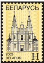
Софийский собор в Полоцке