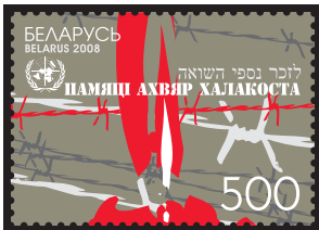
Памяти жертв Холокоста